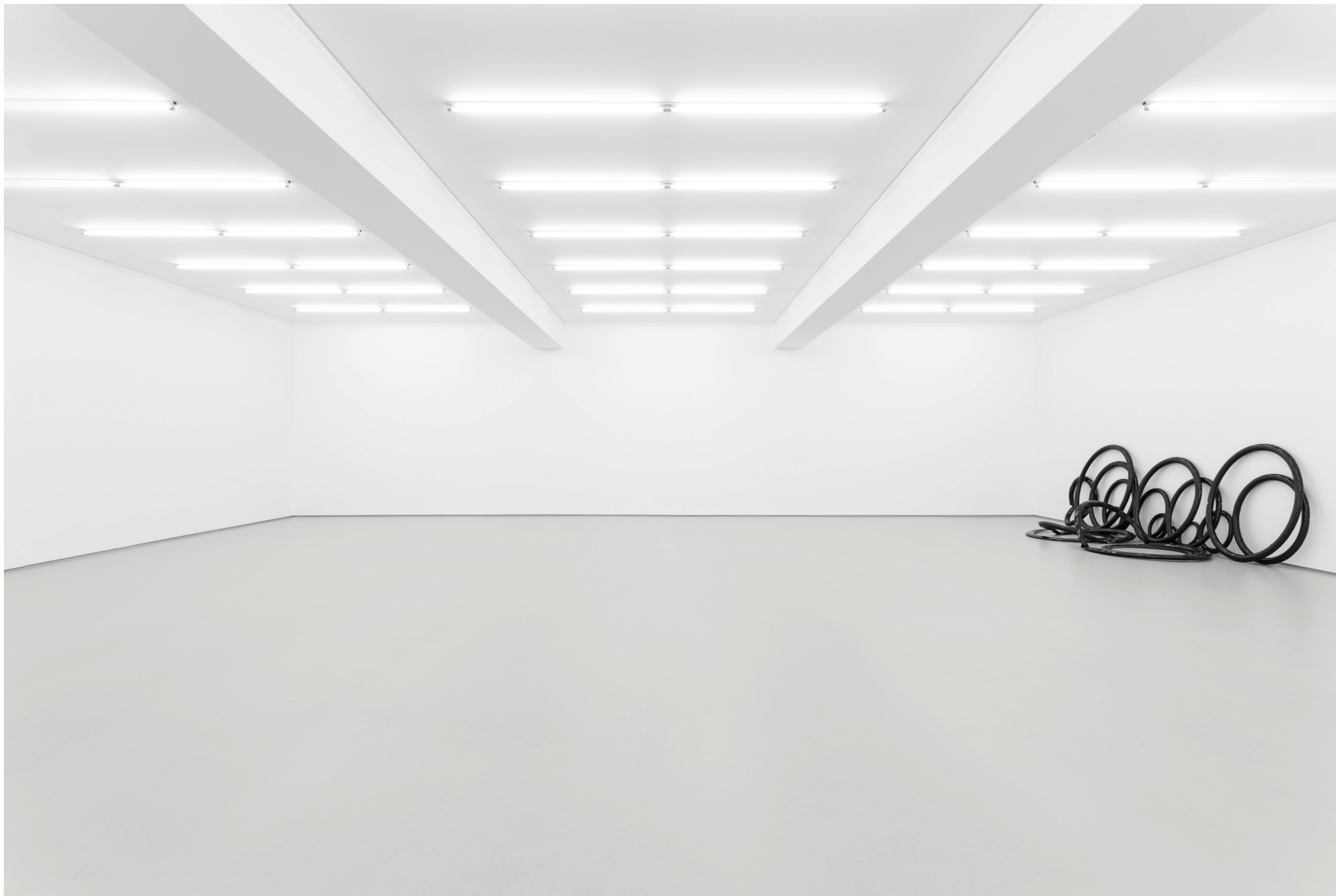
Installation view: Gonçalo Barreiros, Declaração Amigável , 2017.