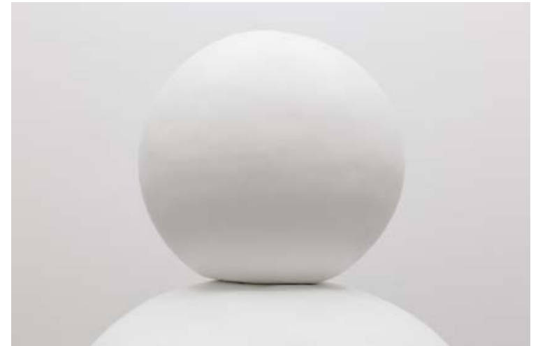
Um boneco de neve não pertence a ninguém (a snowman belongs to no one), 2014 Ferro pintado, cenoura Painted iron, carrot 35 × 25 × 9 cm