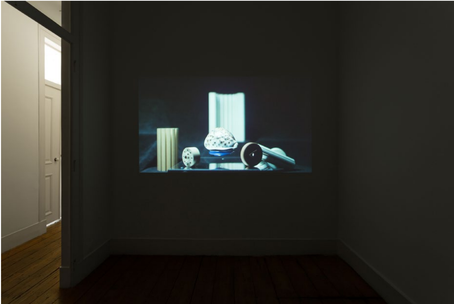
You know why they respect me? Because they think I'm dead, 2016 Video HD, cor, s/ som, 6'13" HD video, color, mute, 6'13"