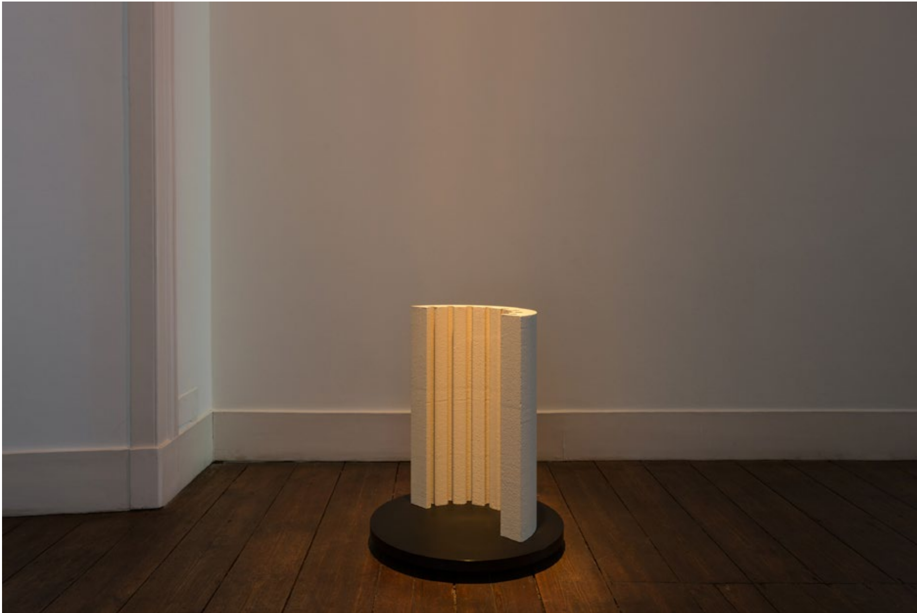
Etero roteante , 2016 Esferovite, plástico, motor Styrofoam, plastic, motor 73 x ø 60 cm