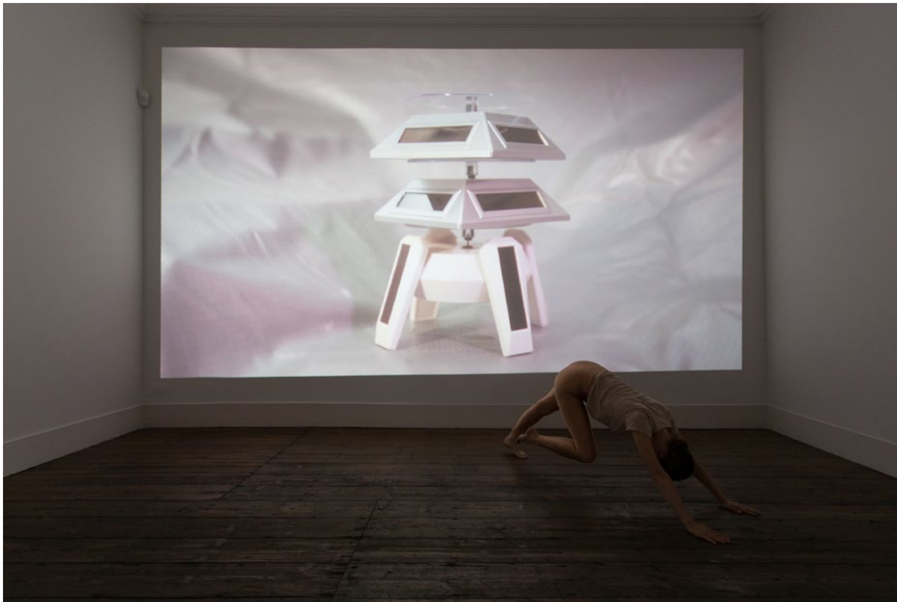
Performance: In lieu of a liane Padrão coreográfico para uma dançarina Choreographic pattern for one dancer Duração variável Duration variable