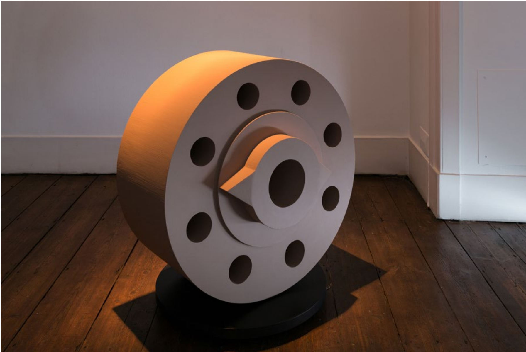
Beatrice , 2016 Esferovite, plástico, motor Styrofoam, plastic, motor 86 × ø 80 cm