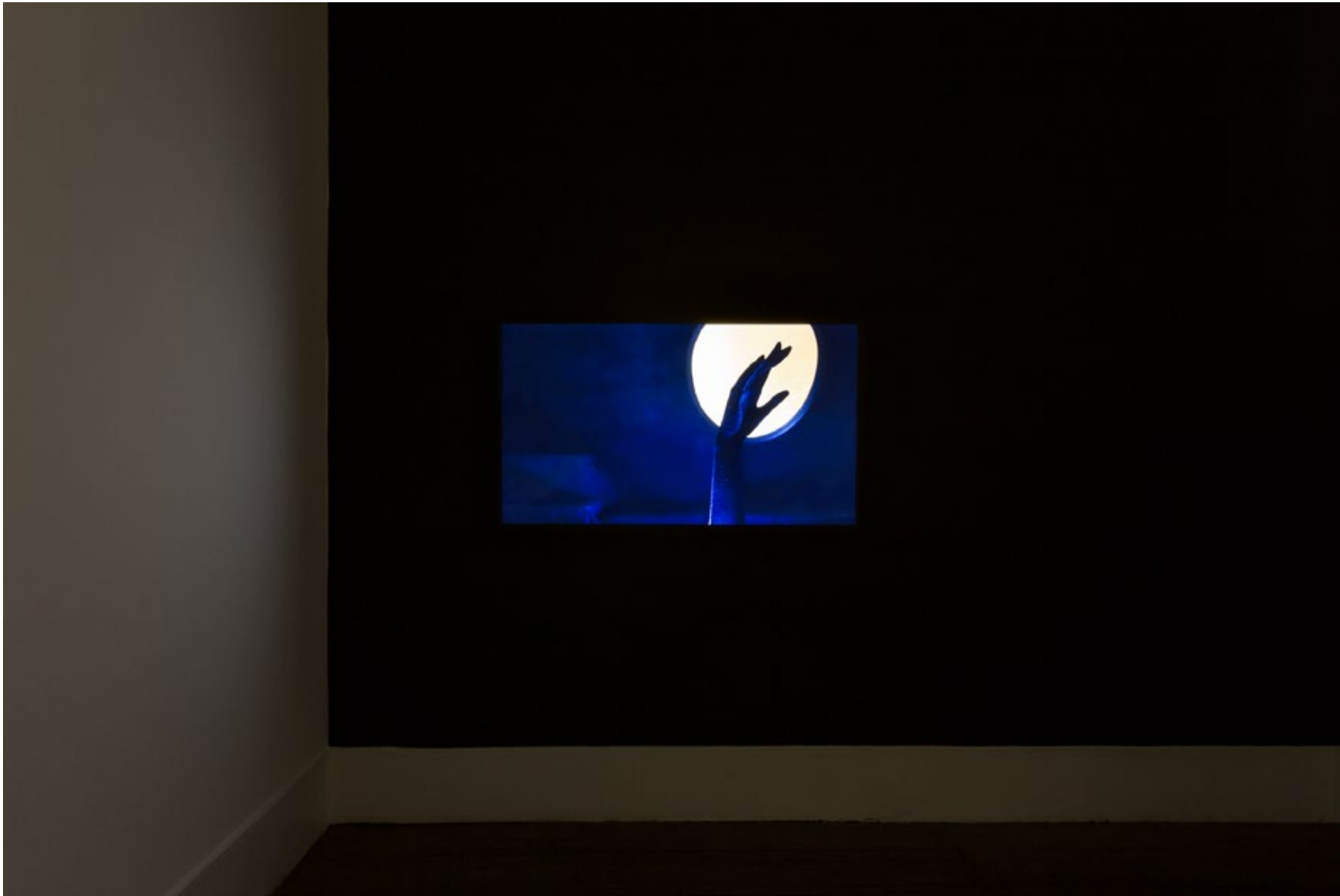
At the Ritz, 2016 Video HD, cor, s/ som, loop HD video, color, mute, loop