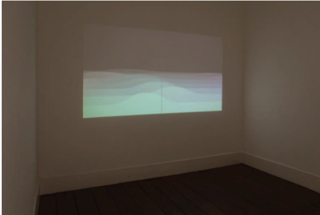
Wave horizon (Sine) , 2010 Animação, preto e branco, som, loop Wave Horizon (Sine) , 2010 B/w animation, sound, loop