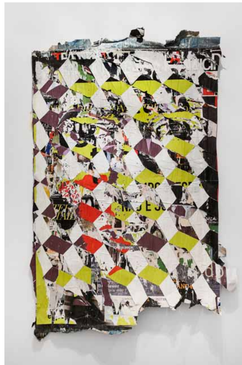
Homogéneo Series #2, 2012 190 × 125 cm (aprox.) Posters recolhidos da rua e esculpidos Posters collected from the street and carved