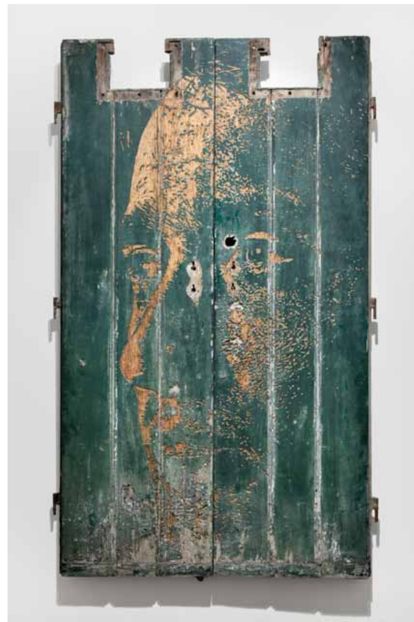
Lacerate Series #1, 2012 120 × 200 cm Porta recolhida da rua e esculpida Door collected from the street and carved