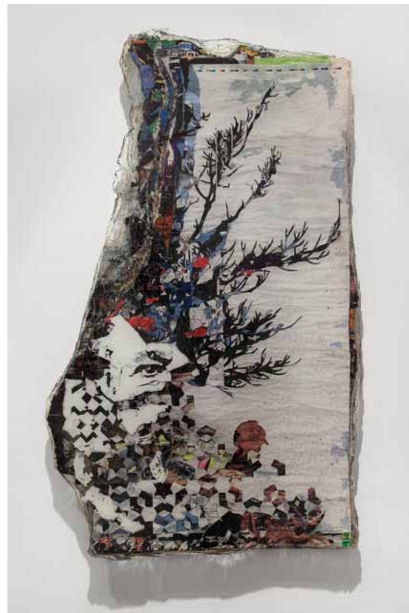
Mobocracy Series #2 , 2012 80 x 125 cm Posters recolhidos da rua, corte a lazer e resina cristal Posters collected from the street, laser cut and crystal epoxy