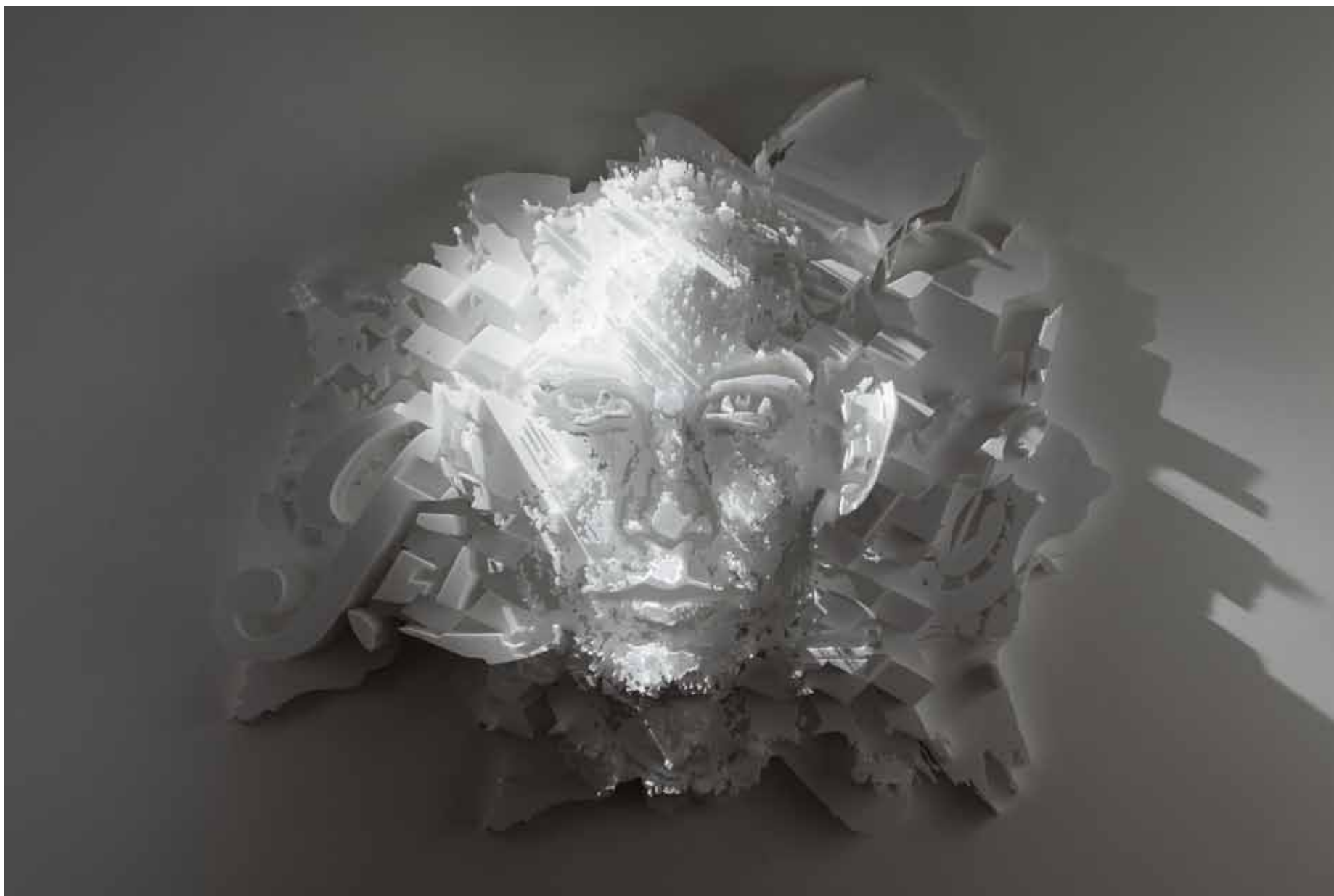
Diorama Series #2, 2012 220 × 180 × 35 cm Esferovite cortada a quente e colada à mão Styrofoam hot-wire cut and pasted by hand