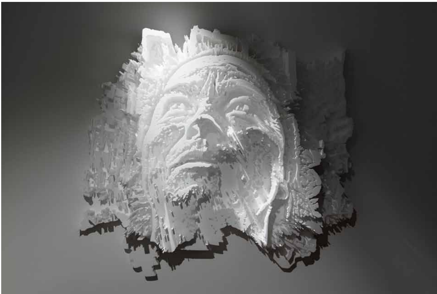
Diorama Series #4, 2012