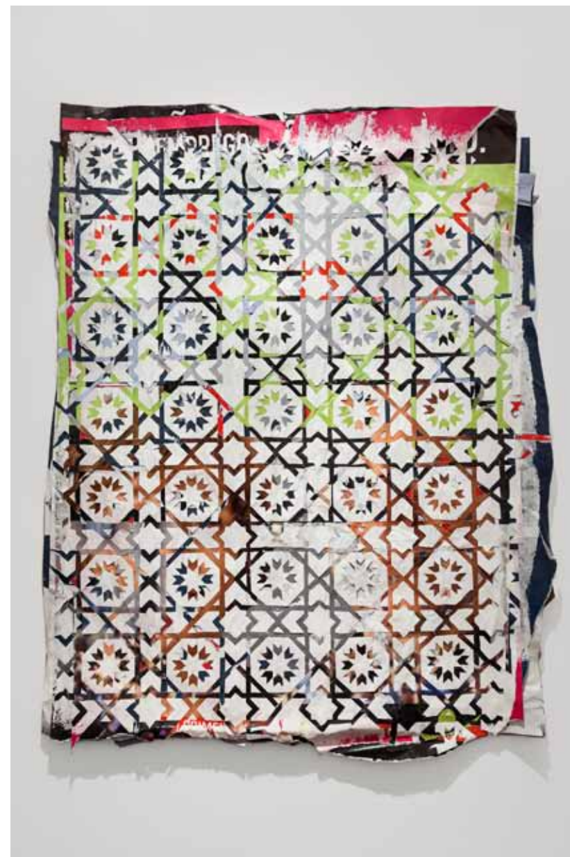
Homogéneo Series #4, 2012 190 × 125 cm (aprox.) Posters recolhidos da rua e esculpidos Posters collected from the street and carved