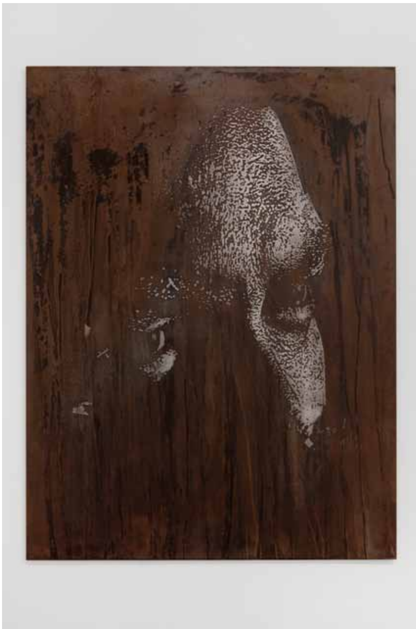
Erode Series #1, 2012 75 x 100 cm Chapa de ferro gravada a ácido e polida Iron plate, acid etched and polished