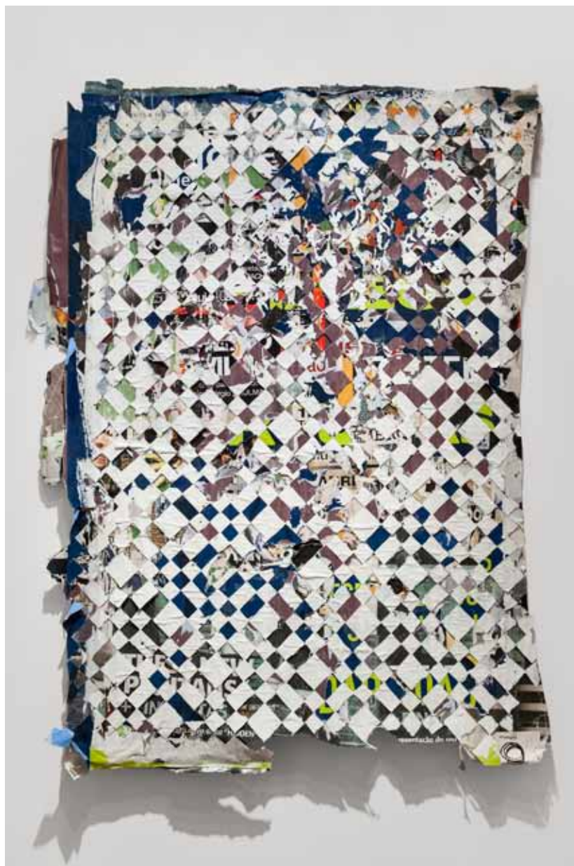
Homogéneo Series #3, 2012 190 × 125 cm (aprox.) Posters recolhidos da rua e esculpidos Posters collected from the street and carved