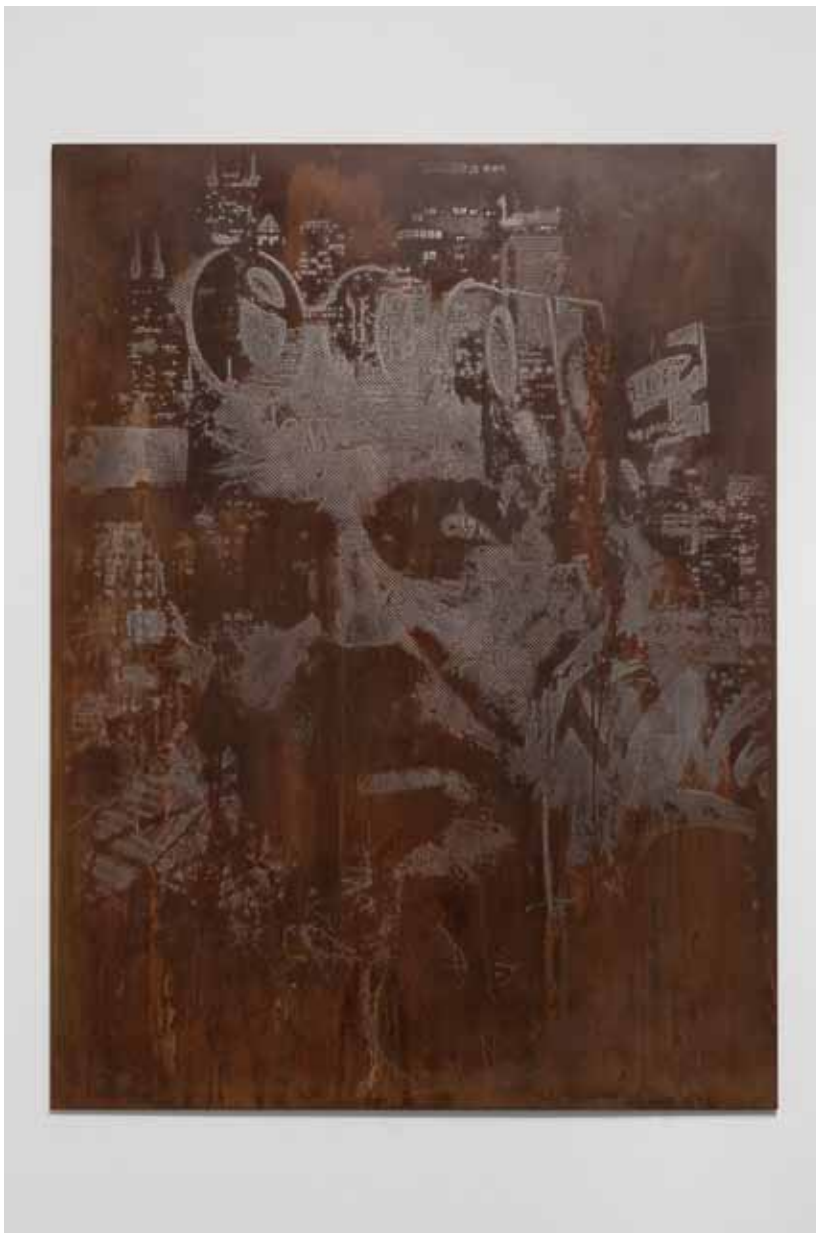
Erode Series #3 , 2012 75 x 100 cm Chapa de ferro gravada a ácido e polida Iron plate, acid etched and polished