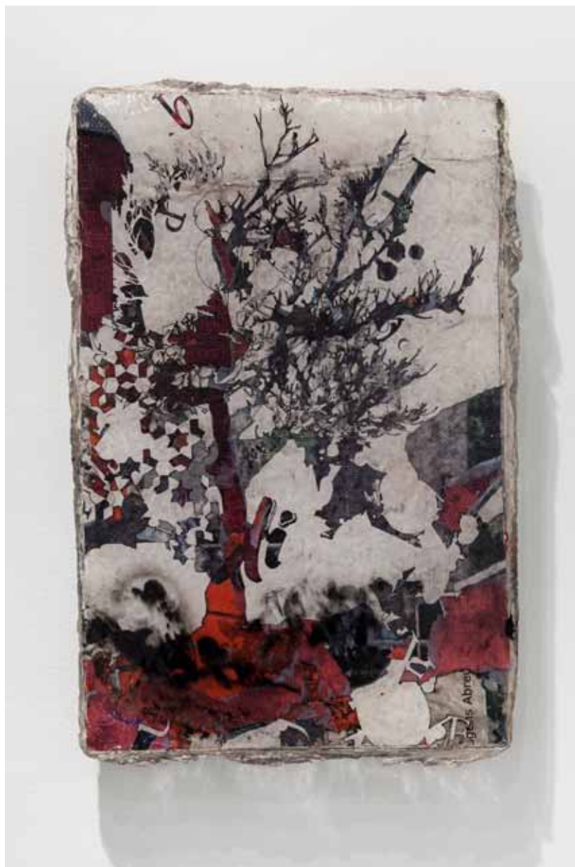
Mobocracy Series #6 , 2012 48 x 74 cm Posters recolhidos da rua, corte a lazer e resina cristal Posters collected from the street, laser cut and crystal epoxy