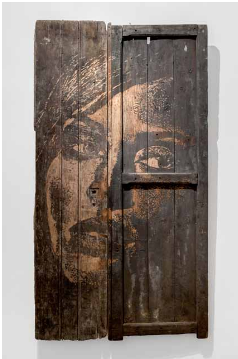
Lacerate Series #3, 2012 202 × 110 cm Porta recolhida da rua e esculpida Door collected from the street and carved