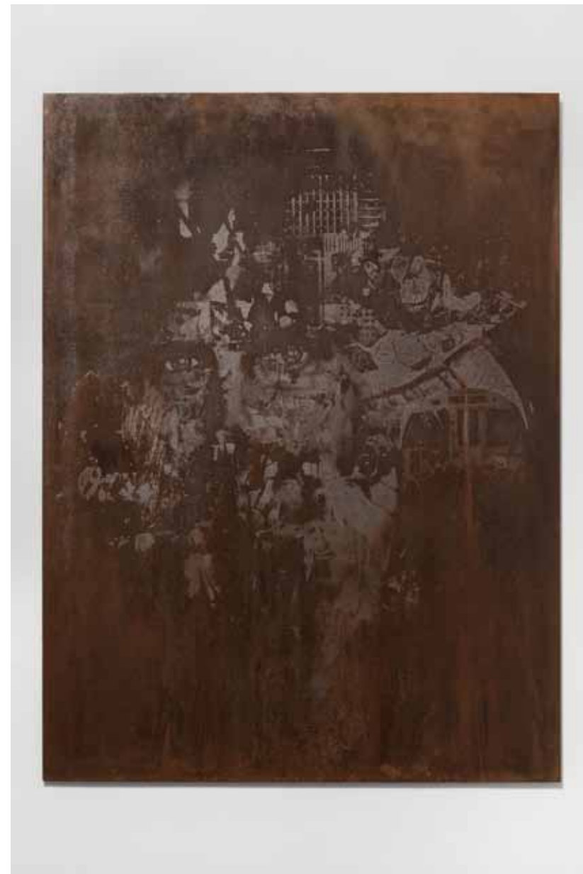
Erode Series #4 , 2012 75 x 100 cm Chapa de ferro gravada a ácido e polida Iron plate, acid etched and polished