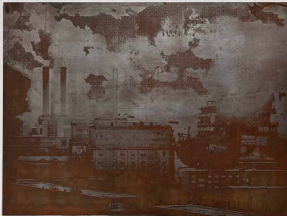
Erode Series #3, 2012 100 × 75 cm Chapa de ferro gravada a ácido e polida Iron plate, acid etched and polished