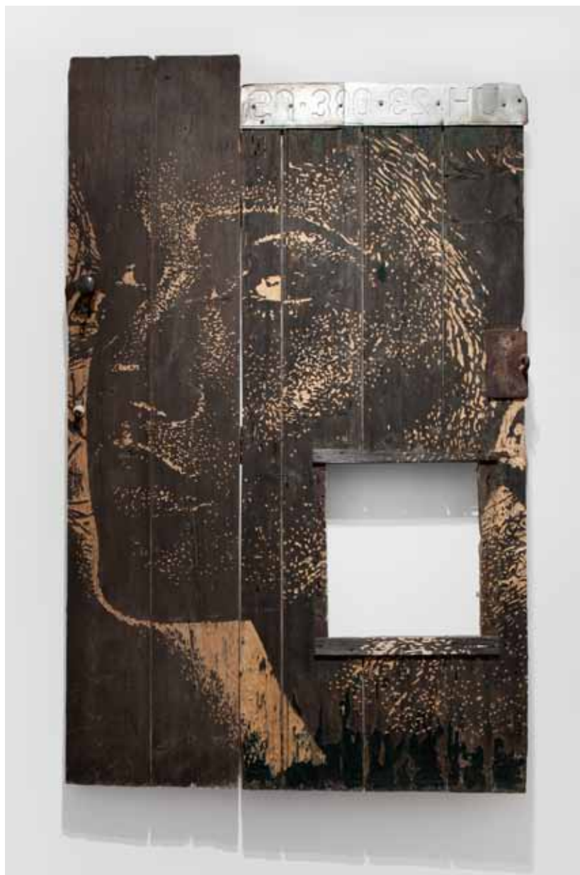
Lacerate Series #3, 2012