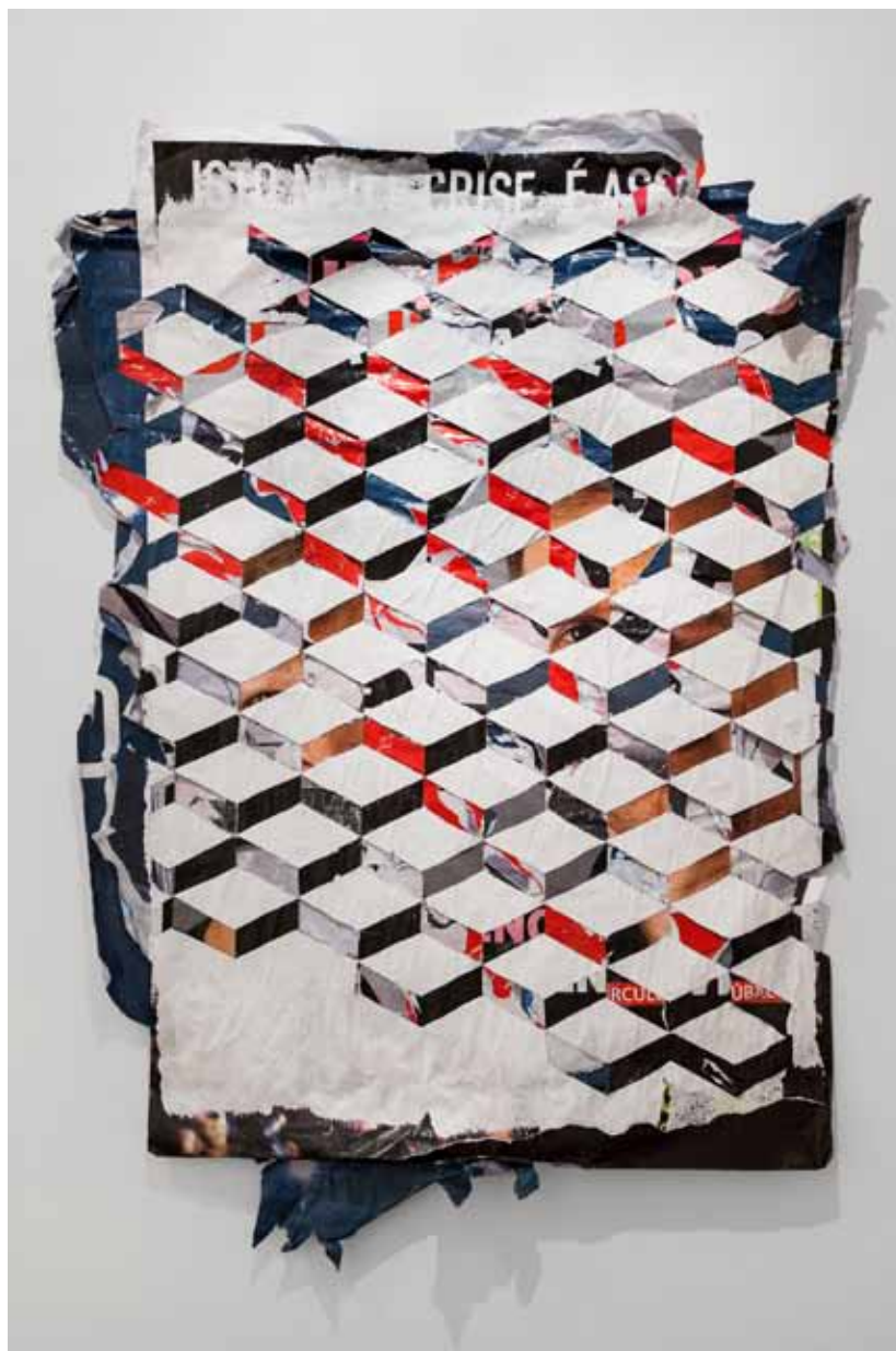
Homogéneo Series #1, 2012 190 × 125 cm (aprox.) Posters recolhidos da rua e esculpidos Posters collected from the street and carved