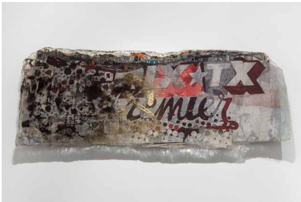
Mobocracy Series #3, 2012 130 x 50 cm Posters recolhidos da rua, corte a lazer e resina cristal Posters collected from the street, laser cut and crystal epoxy