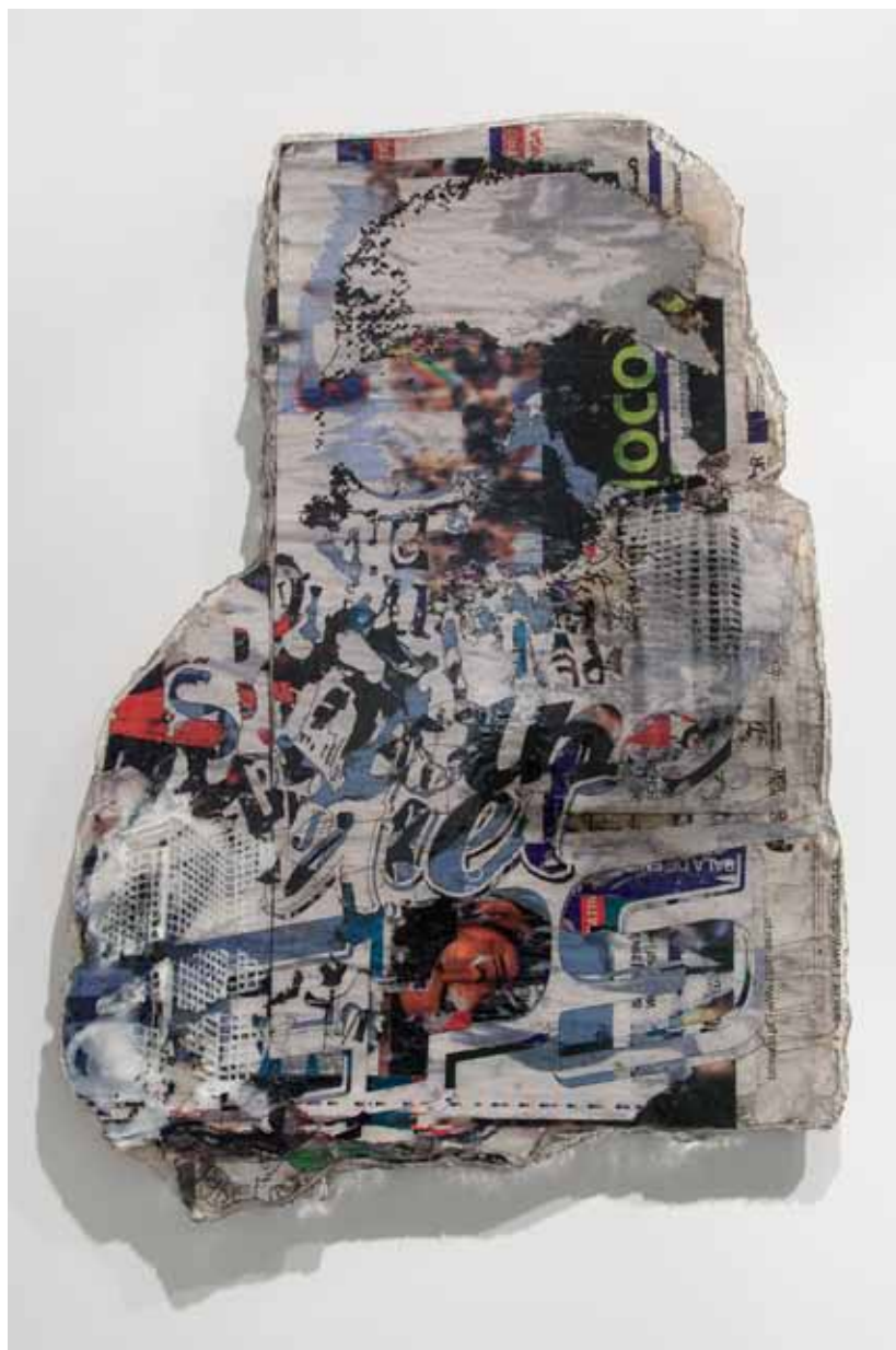
Mobocracy Series #1 , 2012 95 x 130 cm Posters recolhidos da rua, corte a laser e resina cristal Posters collected from the street, laser cut and crystal epoxy