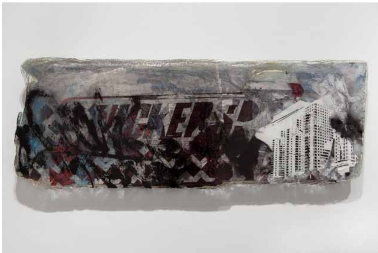
Mobocracy Series #7, 2011 130 x 50 cm Posters recolhidos da rua, corte a lazer e resina cristal Posters collected from the street, laser cut and crystal epoxy