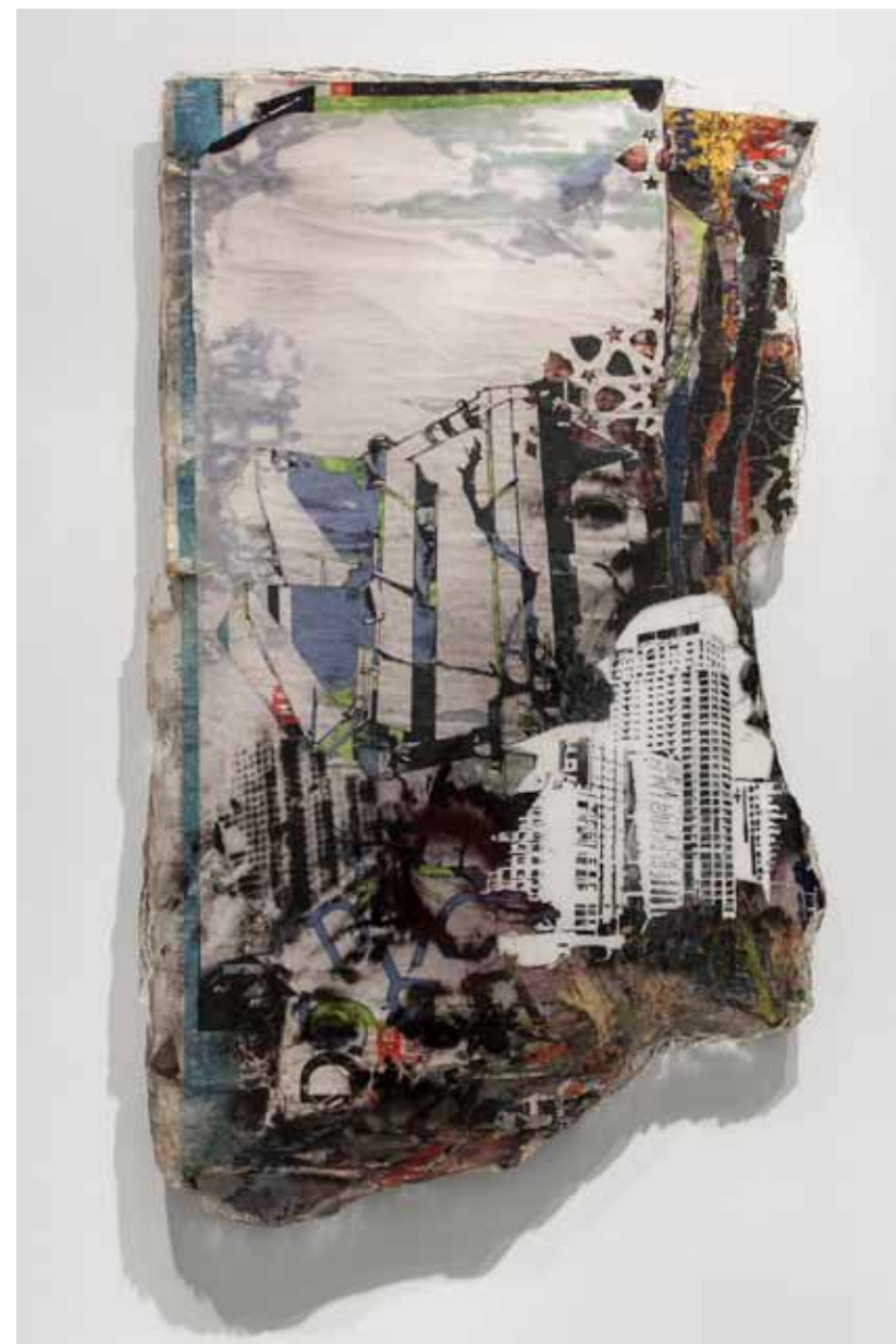
Mobocracy Series #4 , 2012 85 x 145 cm Posters recolhidos da rua, corte a laser e resina cristal Posters collected from the street, laser cut and crystal epoxy