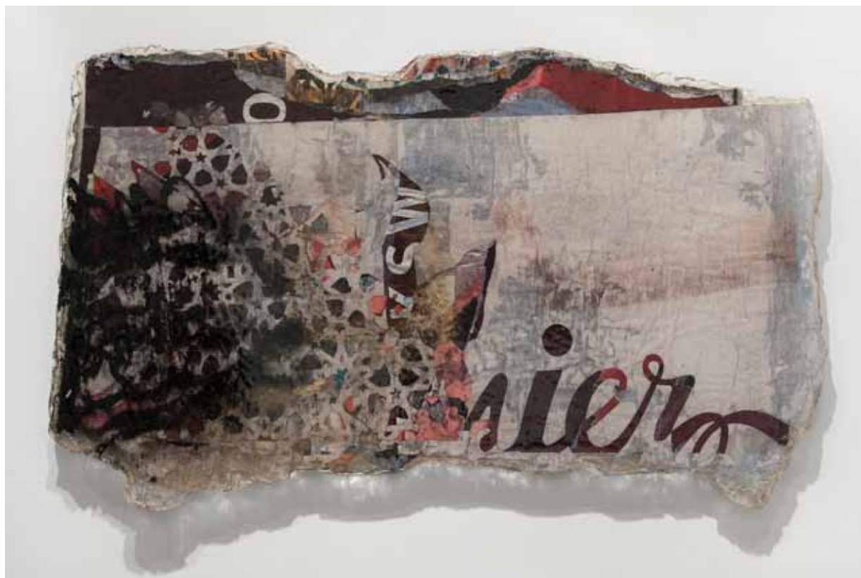
Mobocracy Series #5, 2012 75 x 130 cm Posters recolhidos da rua, corte a lazer e resina cristal Posters collected from the street, laser cut and crystal epoxy