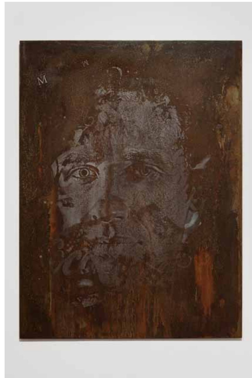
Erode Series #2, 2012 75 x 100 cm Chapa de ferro gravada a ácido e polida Iron plate, acid etched and polished