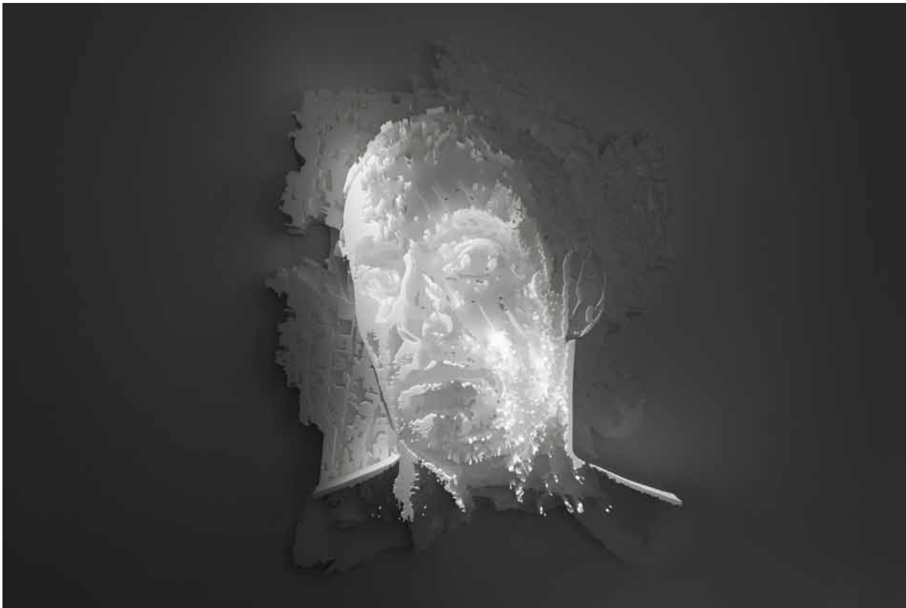
Diorama Series #3, 2012