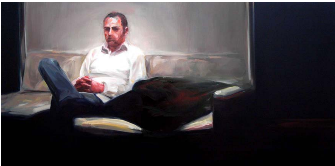
from the series DEZEMBRO | 2007 | oil on canvas | size: 100 x 200 cm