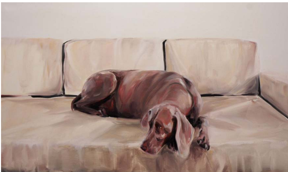
from the series DEZEMBRO | 2007 | oil on canvas | size: 120 x 200 cm