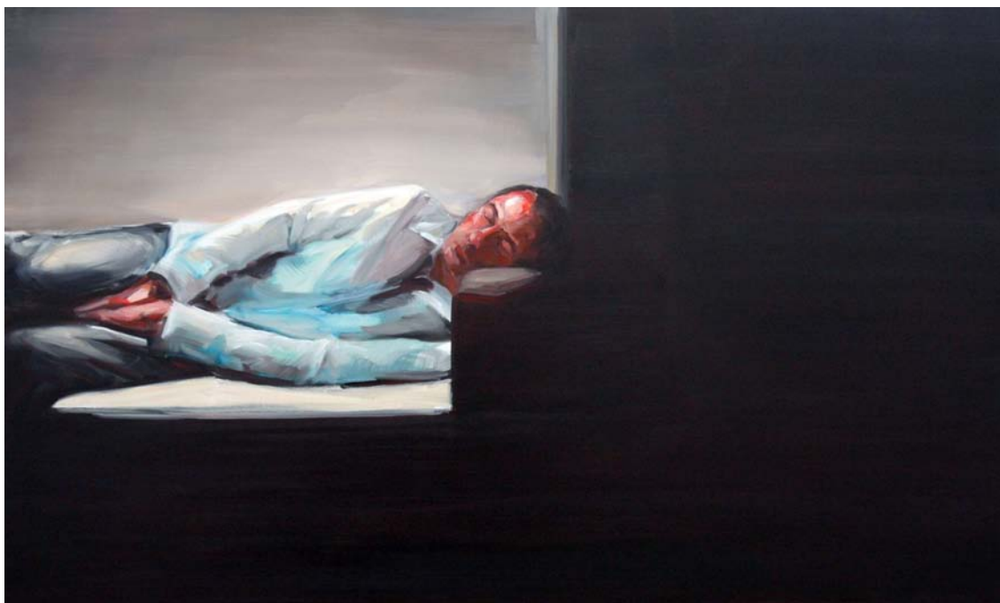
from the series DEZEMBRO | 2007 | oil on canvas | size: 120 x 200 cm