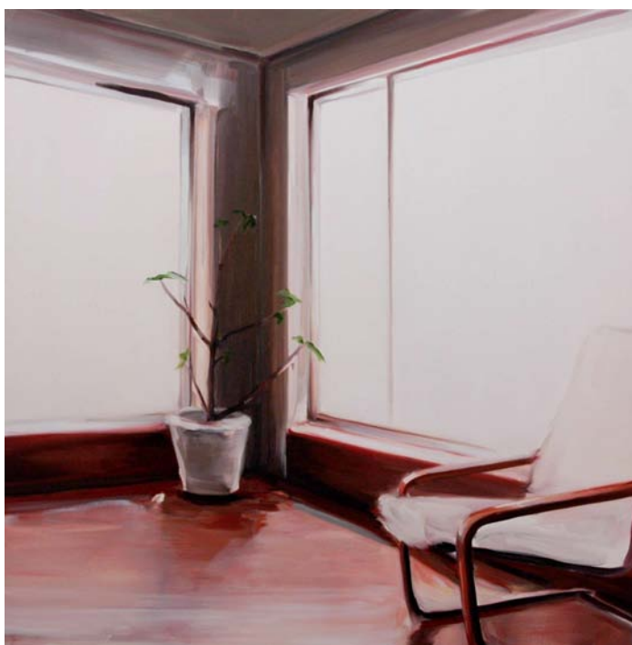
from the series DEZEMBRO | 2007 | oil on canvas | size: 150 x 150 cm