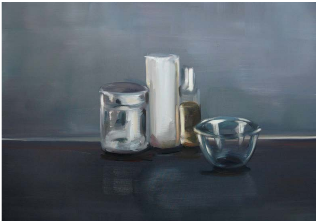
from the series DEZEMBRO | 2007 | oil on canvas | size: 70 x 100 cm