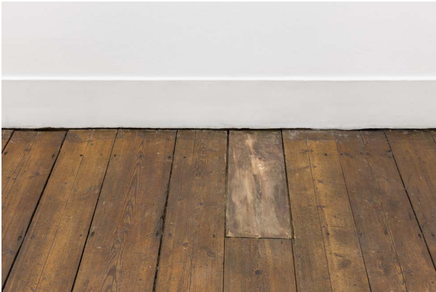
Dente , 2014 Bronze Bronze 3 x 20 x 63 cm (site-specific, dimensões variáveis, variable dimensions)