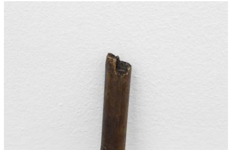
Sem título (vassoura) , 2014 Bronze, vassoura Bronze, broom 35 x 25 x 9 cm