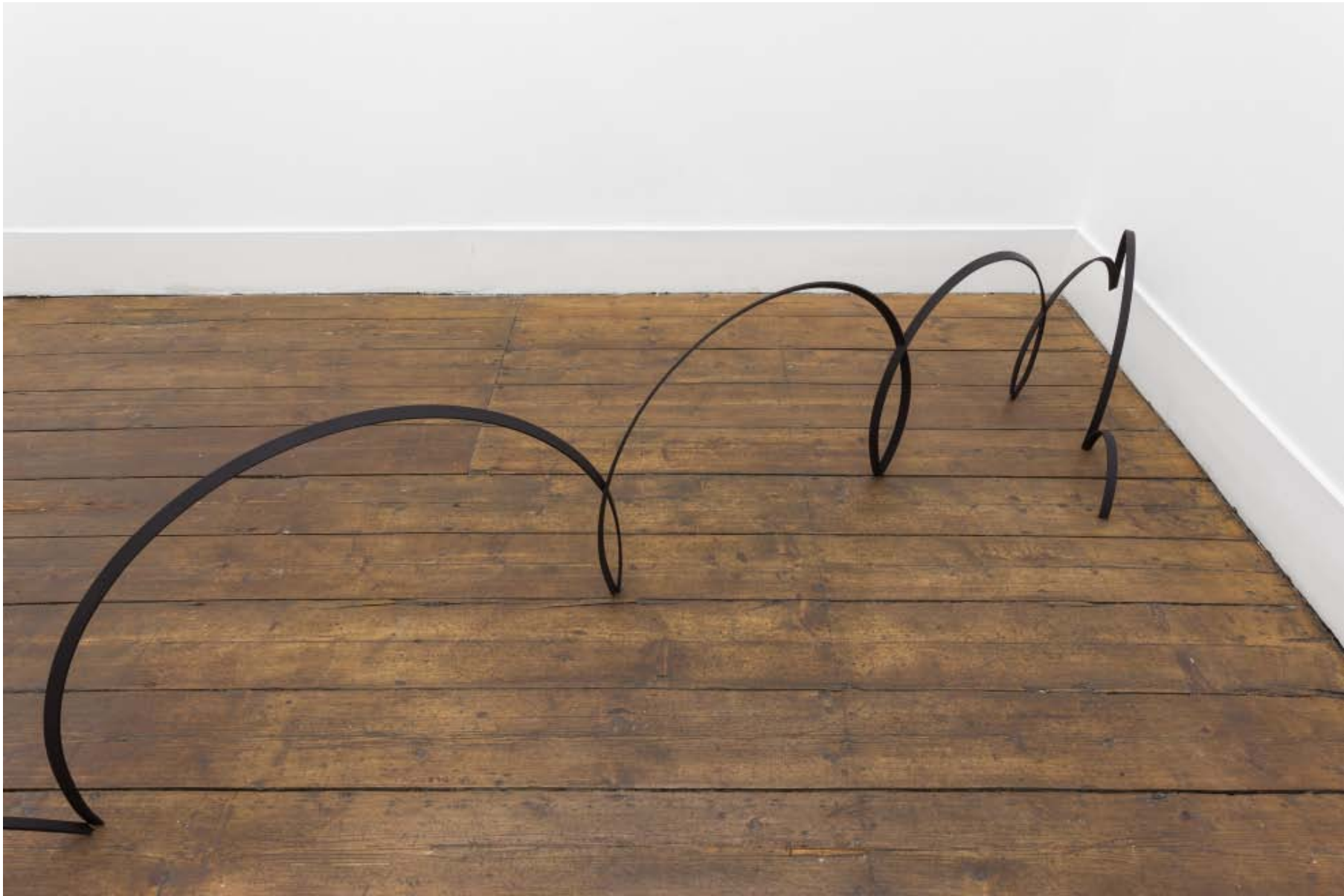
Plof plof , 2014 Ferro pintado Painted iron 93 x 410 x 52 cm